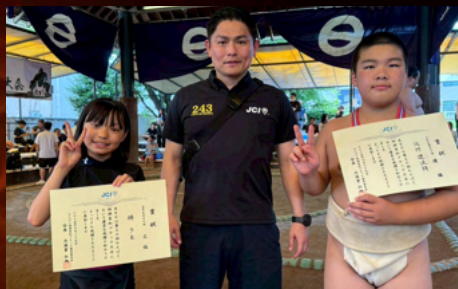
わんぱく相撲 愛知ブロック大会

ASPACウランバートル大会が、モンゴルの首都ウランバートルにて盛大に開催されました。異国の地で出会う仲間たちとの交流は、言葉や文化を超えた絆を育み、世界各国の会頭が集う議論の場では、視野を広げる多くの学びがありました。GALAの華やかな雰囲気包まれながら、国境を越えた友情と刺激的な旅路を体感し、時間が過ぎるのも忘れるほどの濃密な数日間となりました。