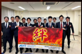
2月例会 「Join the Movement」