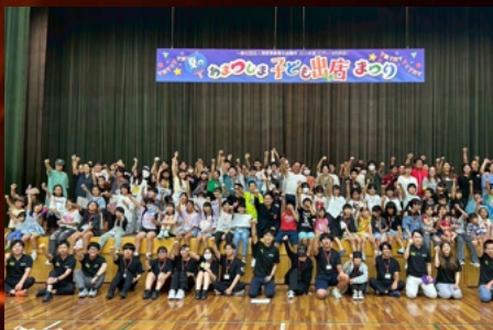
JCデー 「あまつしま 夏の出店大作戦！」 (8月例会)

愛津島市文化会館にて「夏のあまつしま子ども出店まつり」を開催しました。本例会ではJCデー「あまつしま 夏の出店大作戦！」(8月例会)と題し、小学校4、5、6年生の子供たちを募集しブース出店を体験していただきました。70名を超える子供たちが参加をし、限られた予算の中でどうしたら周りのお店よりお客様を呼べるのか、どうしたらお客様は満足するのかという出店の難しさを体感しながらチーム毎に力を合わせてお店を創り上げました。そして、当日多くのお客様を迎え入れ、苦労や失敗がある中でもそれらを乗り越え、やり切り達成感や満足感を味わうことで子供たちの自己肯定感を向上させることができました。