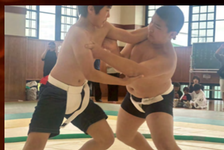
わんぱく相撲海部津島場所 (5月例会)

津島市の錬成館にて第21回わんぱく相撲海部津島場所を開催しました。当日は130名を超える子供たちにご参加いただきました。子供たちには日本の国技である相撲を通じて勝ち負けとは別に対戦相手への敬意や感謝など礼儀礼節を学んでいただくことができました。当日は海部津島地域の高校生の皆さまに学生ボランティアとしてご参加いただきました。愛知県立五条高等学校 愛知県立佐屋高等学校 愛知県立清林館高等学校 愛知県立津島北高等学校 愛知県立津島北翔高等学校 愛知県立美和高等学校 学校法人愛西学園 愛知黎明高等学校 ご協力いただき誠にありがとうございました。